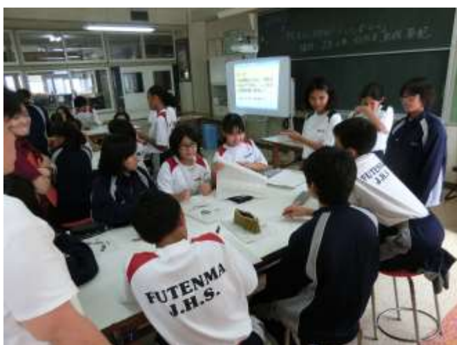
学習委員の先輩から説明を聞く1年生