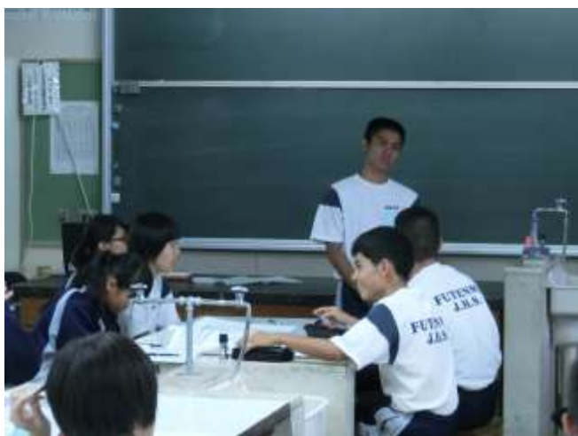
3年生はメモを見ないで発表します。