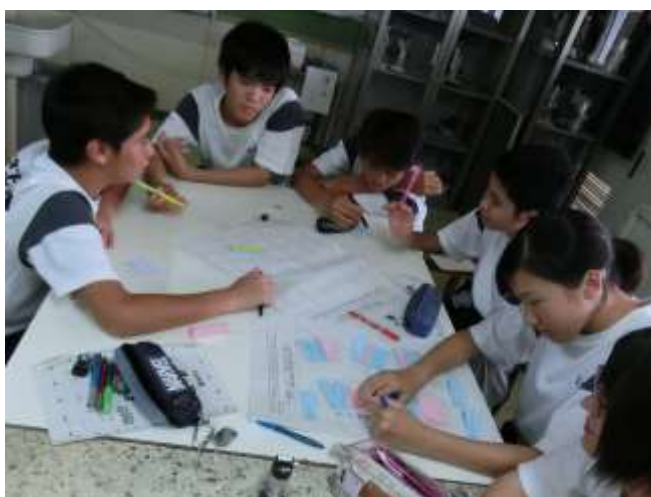
3年生にもなれば、話し合いもスムーズです