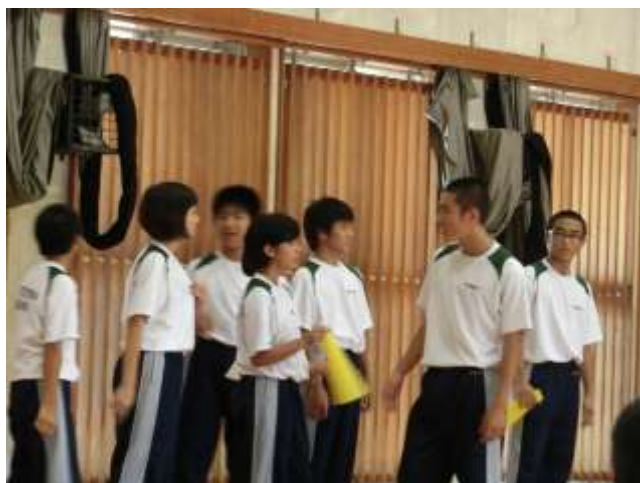
地区陸の新ダンスの提案を2年生が行いました