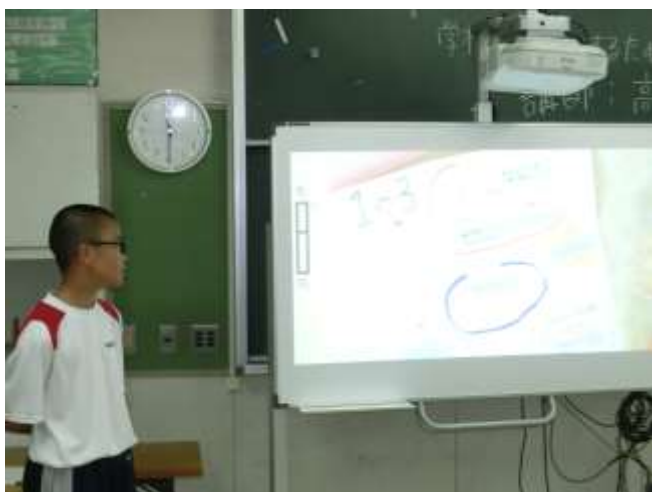
1年生は投影機を用いて発表しました