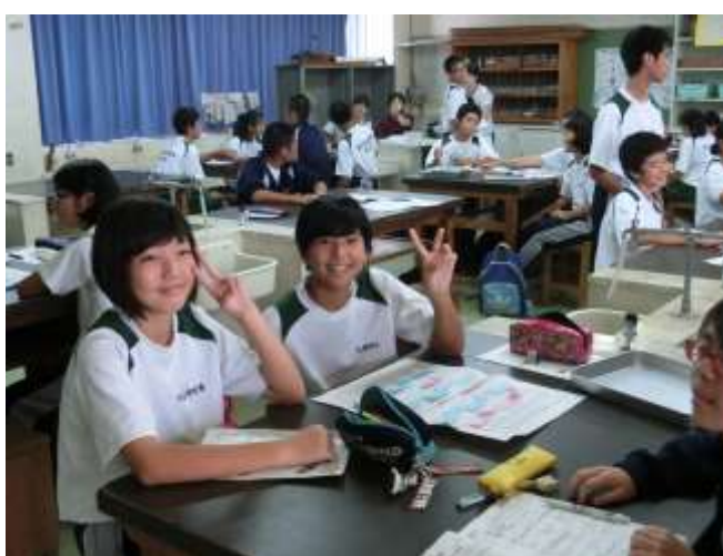
2年生は愛嬌があります。※真剣に話し合ってますよ