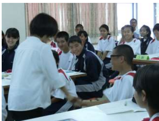
「レインボー6を意識した学習規律」 教頭先生の話に盛り上がります