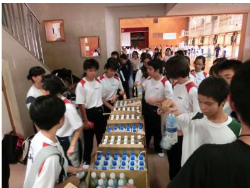
最後は飲み物をもって解散です。1日お疲れ様でした。