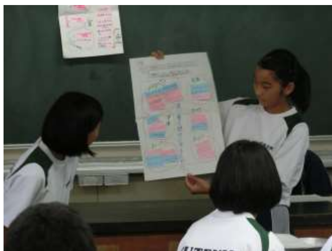
2年生は、仲よく二人で発表です